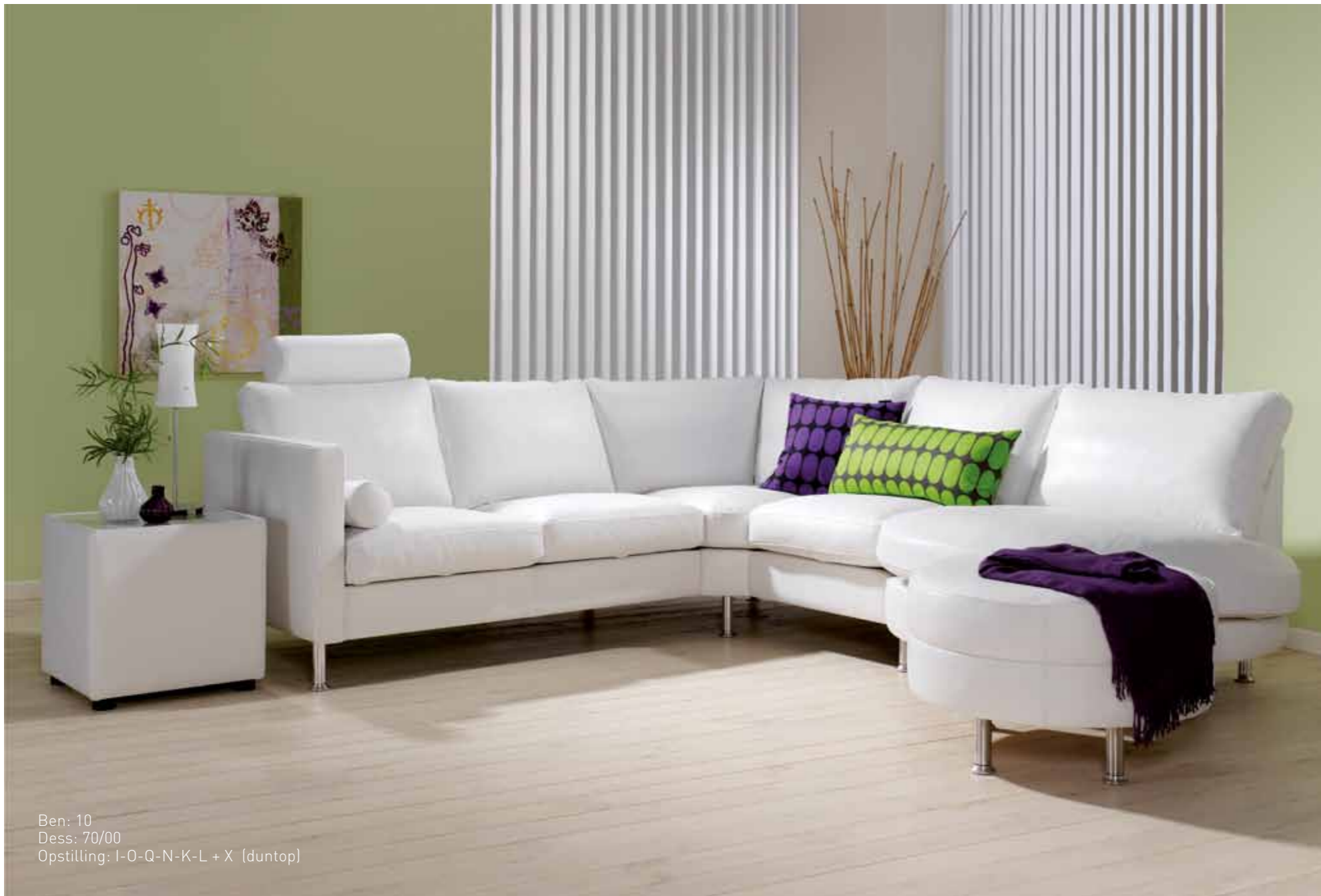
Ben: 10 Dess: 70/00 Opstilling: I-O-Q-N-K-L + X (duntop)