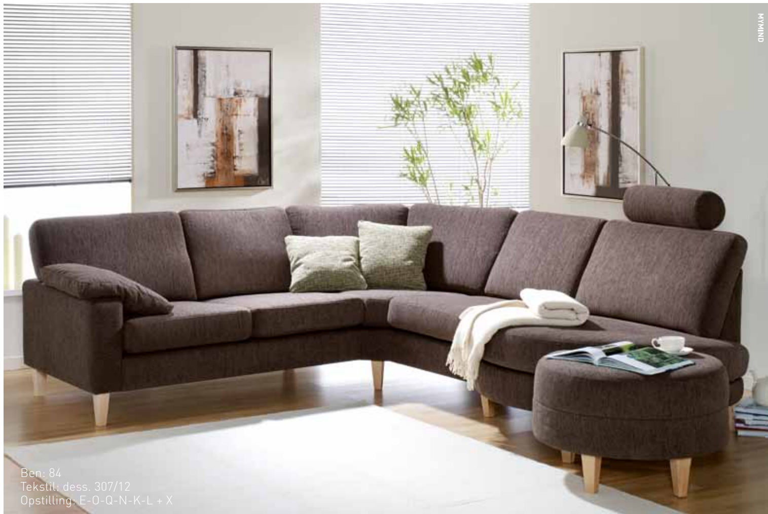
Ben: 84 Tekstil: dess. 307/12 Opstilling: E-O-Q-N-K-L + X

Uanset om du har en stor åben stue eller en lejlighed med knap så meget plads, kan du kombinere dig til den perfekte sofa. Tag stilling til den rigtige vinkel mod fladskærmen eller resten af din indretningen af rummet, når du designer din sofa. Lad dig aldrig begrænse - kun udfordre.