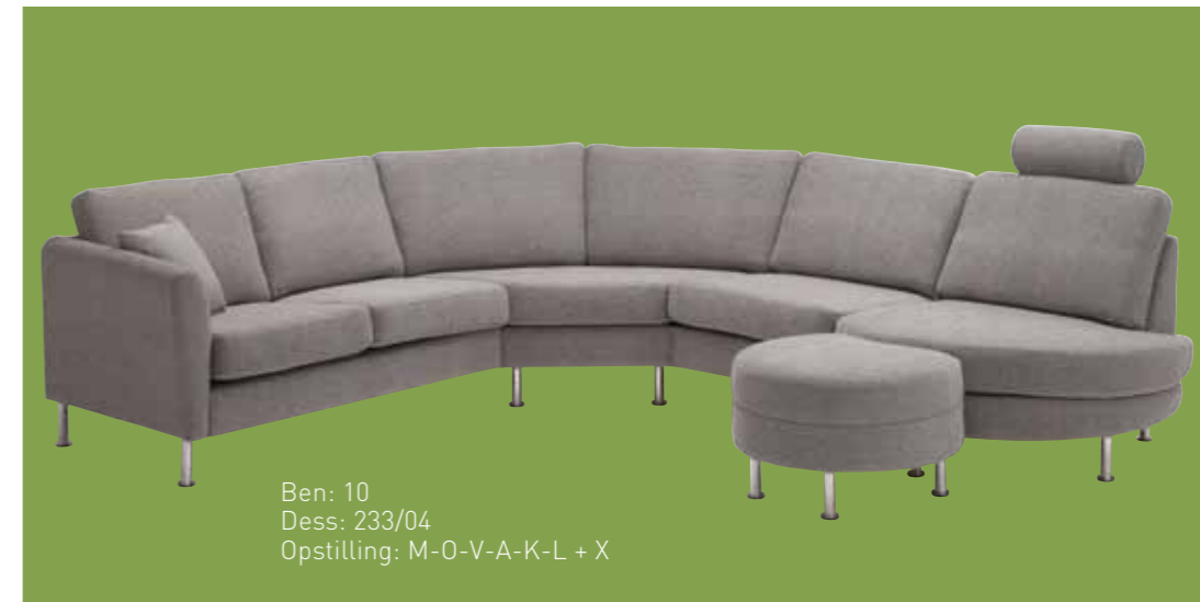
Ben: 10 Dess: 233/04 Opstilling: M-O-V-A-K-L + X