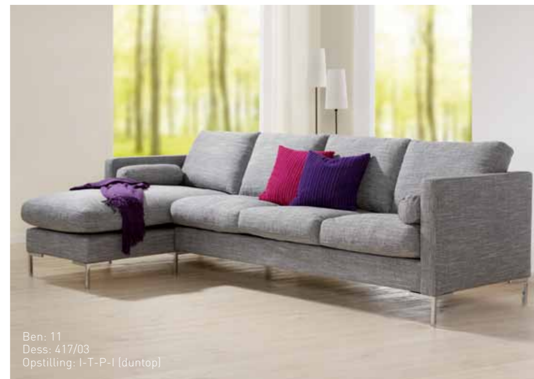
Ben: 11 Dess: 417/03 Opstilling: I-T-P-I (duntop)